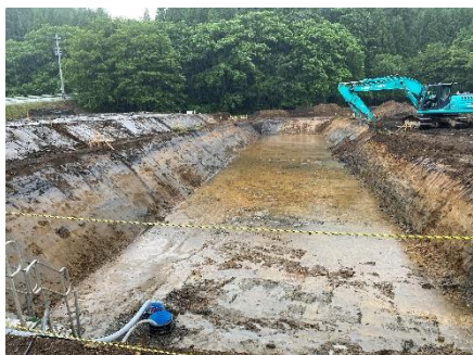
仮沈砂地造成状況