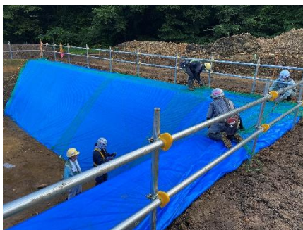
仮沈砂地シート敷設状況