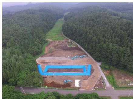
仮沈砂地設置完了