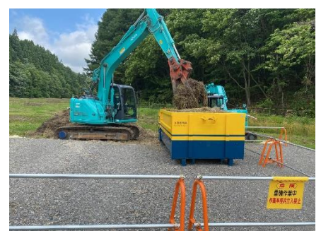
一般廃棄物として搬出